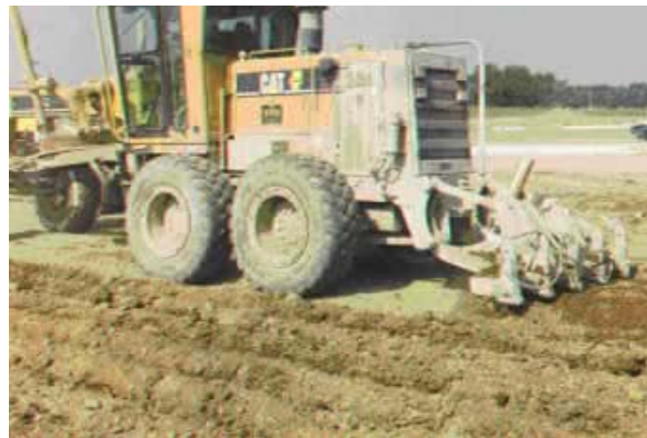
Figura 8: Escarificación antes de la aplicación de la cal.

En el pasado era una práctica común escarificar antes de la aplicación. Hoy en día, debido a la disponibilidad de mezcladores superiores, la cal a menudo es aplicada sin la escarificación. Los camiones de cal también pueden transitar la carretera con más facilidad si está compactada, más bien que escarificada, en particular sobre suelos mojados. La principal desventaja de este procedimiento, sin embargo, se da por factores meteorológicos; cuando la cal es colocada sobre una superficie lisa, hay mayor posibilidad para la pérdida debido al viento y al proceso, particularmente si la mezcla no se realiza de inmediato. Para eliminar la pérdida hacia los lados, se puede construir un pequeño camellón, utilizando material del camino (Figura 9).