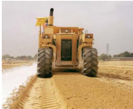
Figura14: Estabilizadora de suelos utilizada para la mezcla inicial.

Las estabilizadoras de suelos (Ej. CAT SS-250B) pueden ser utilizadas para asegurar la mezcla cuidadosa de la cal, el suelo, y el agua (Figura 14). Con muchas estabilizadoras de suelos, el agua puede añadirse al tambor de mezcla durante el proceso (Figura15). Este es el método óptimo de adición de agua a la cal (cal viva o hidratada) y al suelo secos, durante la mezcla preliminar y la etapa de riego.