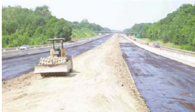
Figura19: Imprimación con emulsión.

cal deberá mantenerse húmeda para ayudar al incremento de resistencia. Esto se conoce como "curando" y puede hacerse de dos maneras: (a) curado húmedo, que consiste en mantener la superficie en una condición húmeda a través de un rociado leve y compactándolo cuando sea necesario, y (b) curado con membrana, que implica el sellado de la capa compactada con una emulsión bituminosa, ya sea en una o varias aplicaciones (Figura19). Una dosificación típica de aplicación es de 0.12 a 0.30 galones por metro cuadrado.