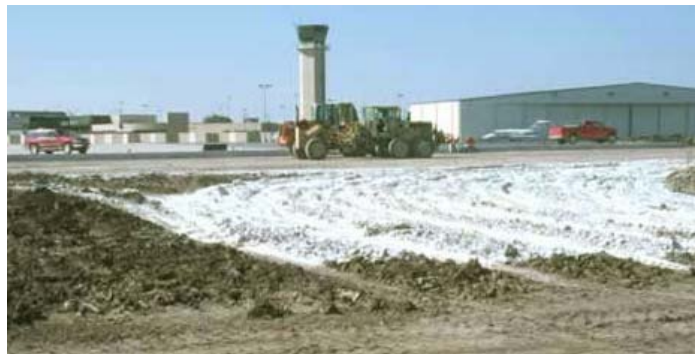
Figura 21: Proyecto de estabilización en un aeropuerto.

La cal tiene una historia extensa como una opción de tratamiento de suelos para la construcción de aeropuertos. Los ejemplos incluyen el Aeropuerto Internacional de Denver, el Aeropuerto Dallas Ft. Worth y Newark. Muchos aeropuertos en los Estados Unidos se amplían alargando las pistas de aterrizaje y despegue, calles de taxeo y estacionamientos (Figura 21).