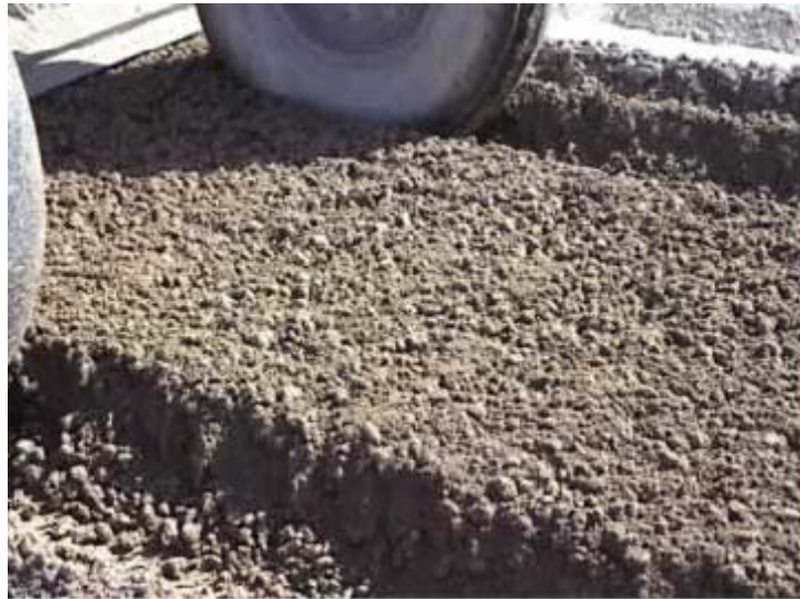
Figura 4. Arcilla floculada con cal.