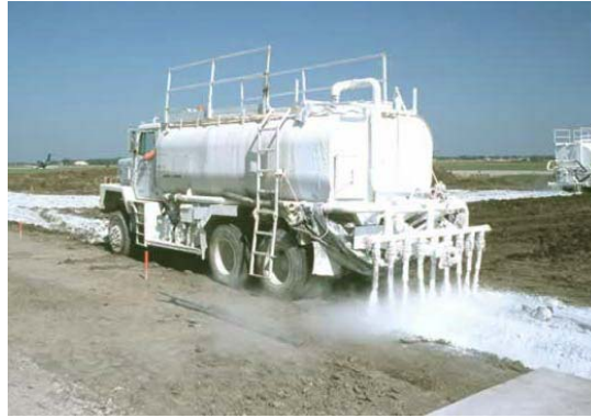
Figura 11: Ejemplo de aplicación de lechada.