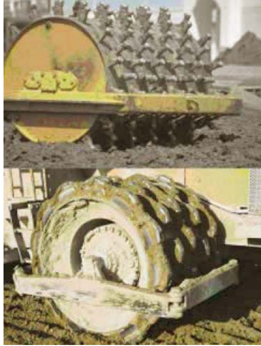
Figura17: Compactadores “Pata de cabra” (arriba) y “de almohadillas” (abajo)

Equipo: para asegurar una compactación adecuada, el equipo deberá adaptarse a la profundidad de la capa. La compactación puede lograrse utilizando compactador pesado de neumáticos o rodo vibratorio o una combinación de la “pata de cabra” y un compactador ligero “de almohadilla” (Figura17). Comúnmente, la superficie final de compactación se completa utilizando un rodo liso (Figura18).