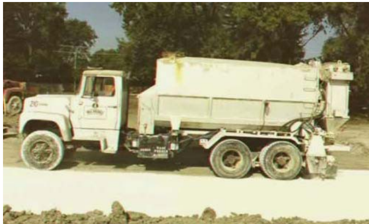
Figura10: Uso de cal seca con aplicación mecánica 4 .

Para el empleo de una barra de extensión neumática, la cal viva se muele ( \frac{1}{4} " por 0) para fluir libremente. aplicador mecánico sobre la parte posterior de un camión o trailer, o una caja separada puede manejar la cal viva menos fina - comúnmente hasta \frac{1}{2} " de diámetro. La subbase puede ser escarificada para este tipo de uso. Este uso trabaja bien en condiciones de suelo muy mojadas.