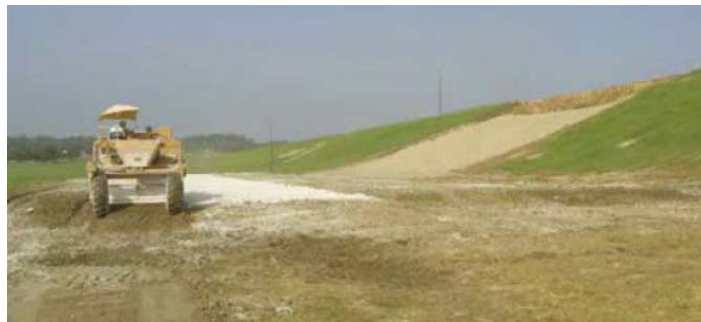
Figura 23: Mezcla preliminar de cal y suelos de terraplén en el área de mezcla.

Para terraplenes donde es prioritario el secado de los suelos, el suelo a menudo es tratado con la cal después de que es traído al terraplén. El suelo no tratado se coloca en capas, típicamente 8 a 12 pulgadas de espesor. Cada capa se trata con cal y se mezcla, reduciendo el contenido de humedad del suelo. La capa se compacta y otra capa de suelo se coloca y el proceso se repite hasta que se completa el terraplén. De nuevo, es importante asegurar que existe una humedad adecuada, en particular si se utiliza cal viva. Si se usa cal viva, es esencial que todas las partículas hayan sido hidratadas.