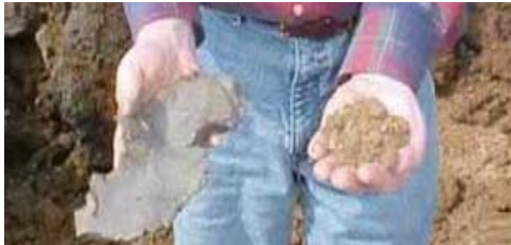
Figura 2: Comparación de arcilla plástica sin tratar y arcilla tratada con cal, después de la mezcla inicial y fraguado.

La cal puede ser utilizada en el tratamiento de suelos, en varios grados o cantidades, dependiendo del objetivo. Una mínima cantidad de cal para tratamiento se utiliza para secar y modificar temporalmente los suelos. Tal tratamiento produce una plataforma de trabajo para la construcción de caminos temporales. Un mayor grado de tratamiento – respaldado por las pruebas, diseño y las técnicas apropiadas de construcción – producen la estabilización estructural permanente del suelo.