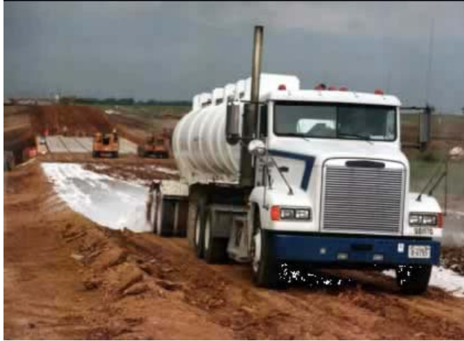
Figura 9: Camellón utilizado para contener la cal antes de la mezcla

Si la cal viva se descarga en “volcanes”, es deseable una superficie lisa, de modo que se alcance una aplicación uniforme con la hoja de la motoniveladora. Por lo anterior, el suelo no debería ser escarificado antes de que la cal viva sea aplicada de esta manera.