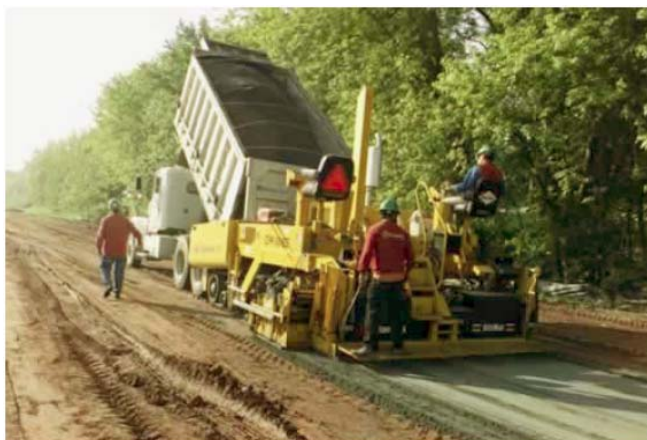
Figura 20: Máquina terminadora de asfalto utilizada para esparcir ceniza volante húmeda.