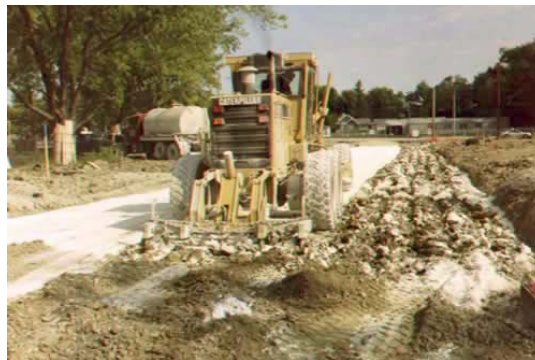
Figura 12: Escarificación después de extensión de cal.

Se requiere una mezcla preliminar para distribuir la cal dentro del suelo y para pulverizar inicialmente el suelo para preparar la adición de agua que inicie la reacción química para la estabilización. Esta mezcla puede iniciar con la escarificación (Figura12). La escarificación puede realizarse aún sin mezcladoras modernas. Durante este proceso o inmediatamente después, el agua deberá agregarse (Figura 13).