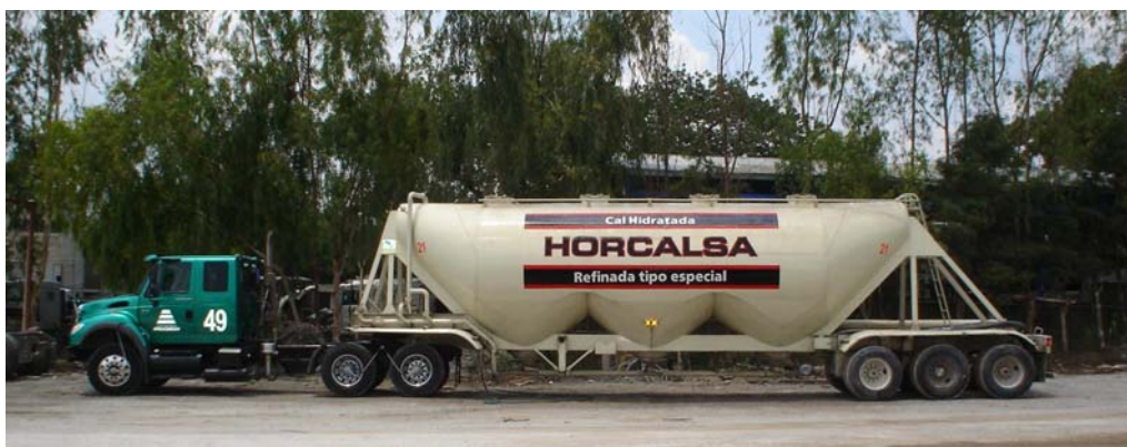
Figura 5: Ejemplo de pipa típicamente usada para entrega de cal seca.

La cal viva o la cal hidratada seca, puede ser entregada en bolsas de papel o bien en pipas (Figura 5). Cuando se transporta en pipa es común que, cada carga de cal seca entregada en un sitio de trabajo lleve una boleta certificando la cantidad de cal a bordo. Además, algunas entidades requieren la certificación de las características químicas de la cal entregada.