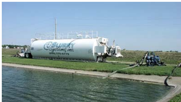
Figura 6: Tanques mezcladores para preparar la lechada de cal en el lugar.

Un segundo método de producción de lechada, que elimina tanques de producción por lotes, implica el empleo de un mezclador compacto con motor (Figura 7). Se carga agua a una presión de 70 psi y cal hidratada, en forma continua en una proporción de 65:35 (en peso) en el mezclador, donde la lechada se produce instantáneamente. La lechada es bombeada directamente en camiones para regarla en el lugar del proyecto. El mezclador y el equipo auxiliar pueden ser montados sobre un pequeño trailer y ser transportados al lugar fácilmente, dando gran flexibilidad a la operación.