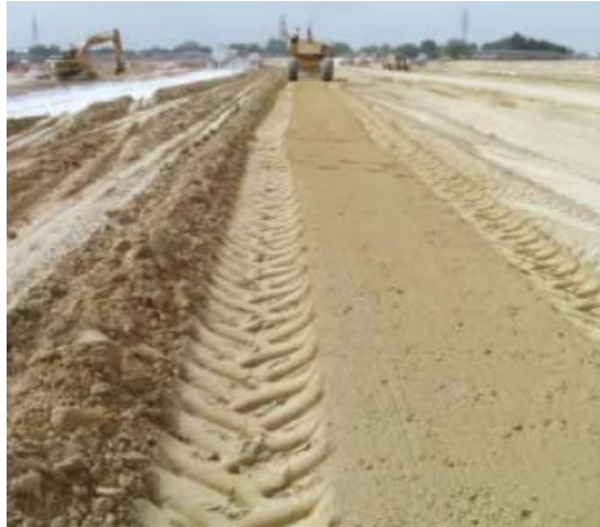
Figura 16: Mezcla y pulverización.

Si se utiliza la cal viva, es esencial que todas las partículas estén hidratada y que hayan sido mezcladas. En el caso de cal viva seca, después del mezclado final, antes de la compactación, inspeccione visualmente el suelo para asegurar que la mezcla ha sido alcanzada. El uso de cal viva seca, a menudo produce manchas ligeras en el suelo, que no merecen atención ya que no son partículas sin hidratar. Si existe la duda, coloque una muestra de estas partículas en agua. Si no se disuelven, son partículas inertes. Si se disuelven, son partículas de cal, que indican que se requiere mezcla adicional antes de la compactación final.