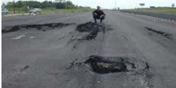
Figura 1: Ejemplo extremo de fracaso de un pavimento por suelos inestables.

El funcionamiento a largo plazo de cualquier proyecto de construcción depende de la calidad de los suelos subyacentes. Los suelos inestables pueden crear problemas significativos en las estructuras y pavimentos (Figura 1). Con el diseño y técnicas de construcción apropiados, el tratamiento con cal transforma químicamente los suelos inestables en materiales utilizables. Adicionalmente, el soporte estructural de los suelos estabilizados con cal puede ser aprovechado en el diseño de pavimentos.