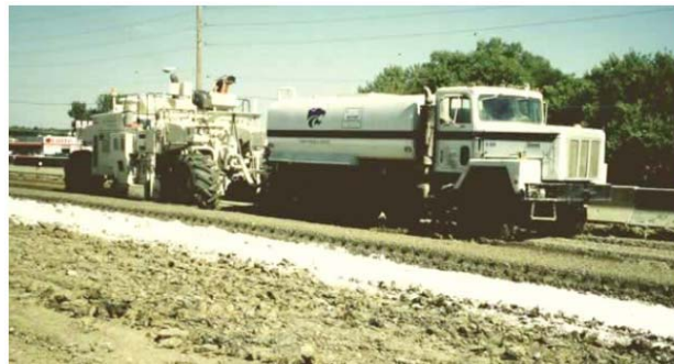
Figura15: Estabilizadora de suelos con camión de agua.

Independientemente del método usado para la adición de agua, es esencial que la cantidad de agua agregada sea la adecuada para asegurar la completa hidratación y llevar el contenido de humedad del suelo 3% arriba del óptimo, antes de la compactación.