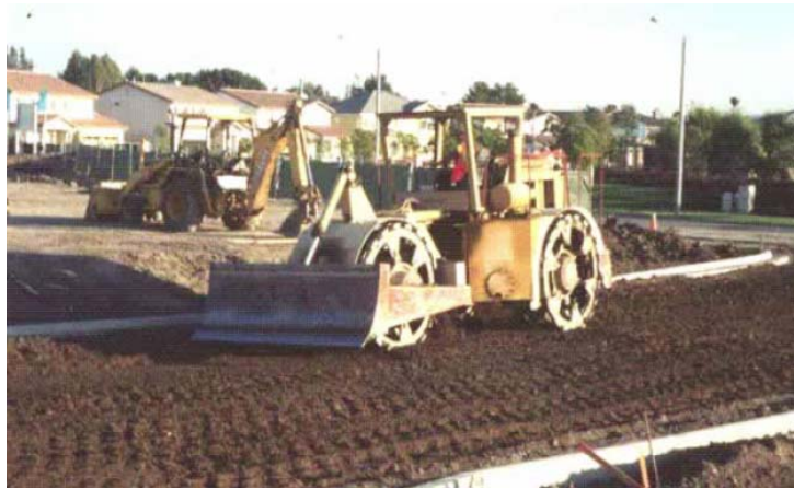
Figura 22: Compactación de suelo estabilizado con cal en una urbanización.

Construcción de calles: El contratista inicia trabajando calles y facilidades. En algunas urbanizaciones el trabajo inicial consiste en la excavación de zanjas para alcantarillas, agua, gas y electricidad. Al excavar estas zanjas se corre el riesgo que las mismas se conviertan en áreas con lodo y muchas veces impasables. Una forma de mitigar este problema es utilizar la cal en la fase inicial de la construcción para modificar el suelo y luego usar tratamientos adicionales para secar el material de los rellenos de las zanjas. Los suelos estabilizados también pueden ser utilizados como fundación para el pavimento final (Figura 22). Los suelos bajo las aceras también pueden ser estabilizados para reducir al mínimo los hundimientos.