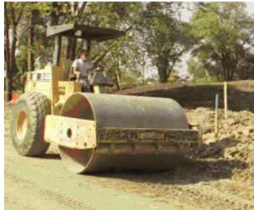
Figura18: Compactador de rodo liso