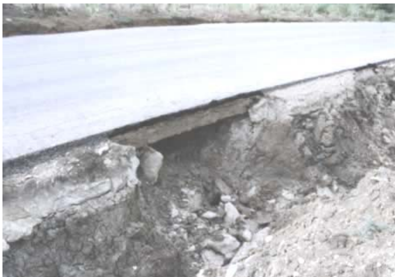
Figura 3: La capa estabilizada con cal soporta la erosión, ilustrando la resistencia.

La cal, sola o en combinación con otros materiales, puede ser utilizada para tratar una gama de tipos de suelos. Las propiedades mineralógicas de los suelos determinarán su grado de reactividad con la cal y la resistencia final que las capas estabilizadas desarrollarán. En general, los suelos arcillosos de grano fino (con un mínimo del 25 por ciento que pasa el tamiz 200 -75 \mu m- y un Índice de Plasticidad mayor que 10) se consideran buenos candidatos para la estabilización. Los suelos que contienen cantidades significativas de material orgánico (mayor que 1 por ciento) o sulfatos (mayor que el 0.3 por ciento) pueden requerir cal adicional y/o procedimientos de construcción especiales.