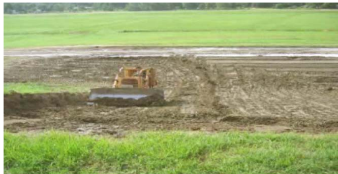
Figura 24: Devolución de suelos tratados del área de mezcla al terraplén.