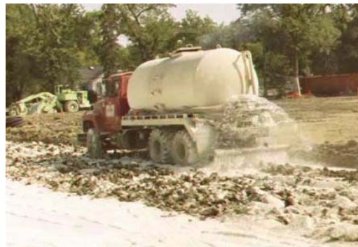
Figura13: Adición de agua después la aplicación de cal seca 5