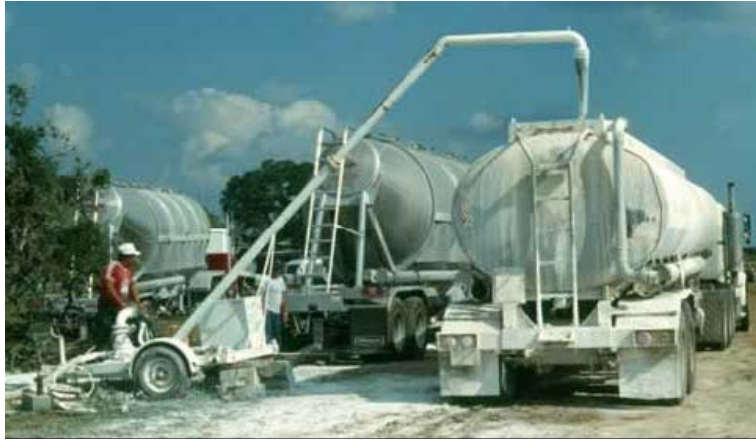
Figura7: Mezcladora de motor.